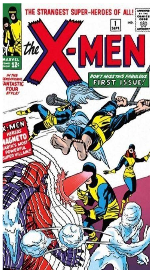
Imagem 1: Capa de X-Men (1963)

exemplo a respeito de como funciona a reformulação de uma concepção pré-estabelecida do que são heróis – homens possuidores de uma beleza inalcançável e com poderes especiais, responsáveis por salvar o dia de um vilão. Devido a esse e a outros fatores, X-Men muitas vezes atua como uma crítica à política.