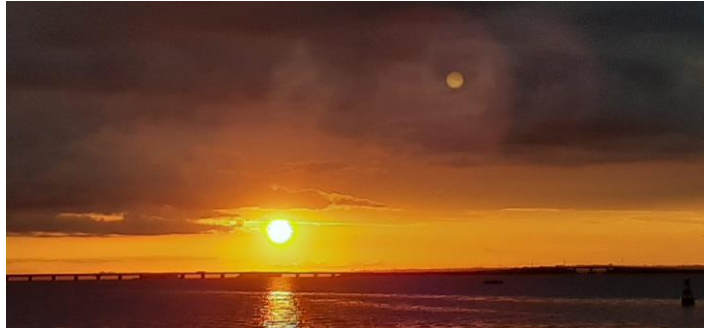
Figura 01 – Pôr do sol de Presidente Epitácio sobre a ponte Hélio Serejo

Neste sentido, a representação da marca da RECeT faz referência ao (famoso) pôr do sol sobre a ponte Hélio Serejo, que liga a cidade ao estado do Mato Grosso do Sul.