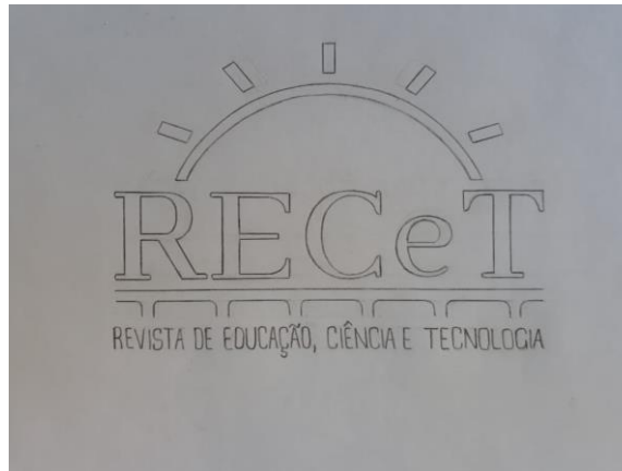
Figura 03 – Pesquisa inicial de construção da marca da RECeT