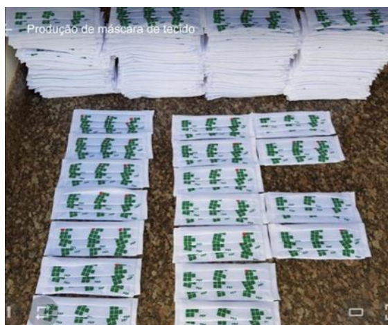
Figura 5: Máscaras caseiras confeccionadas pelo IFSP-PEP