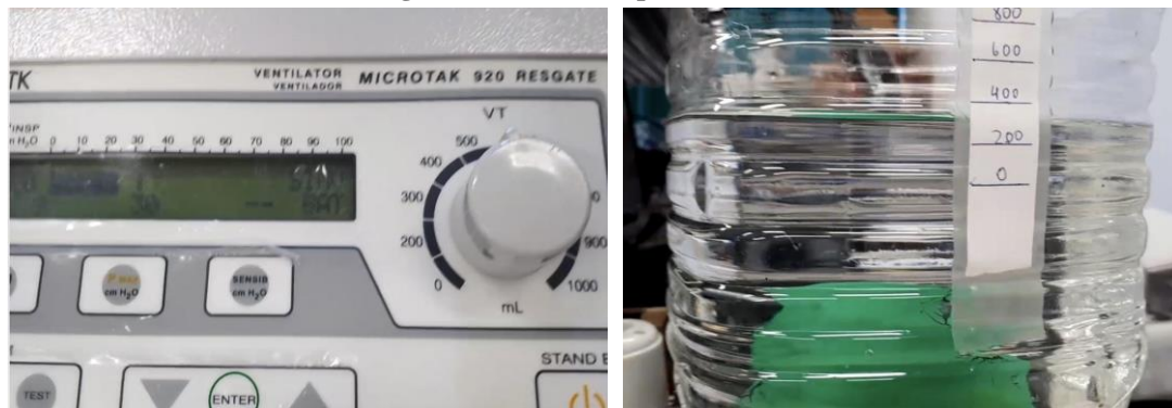
Figura 3: Ventilador pulmonar