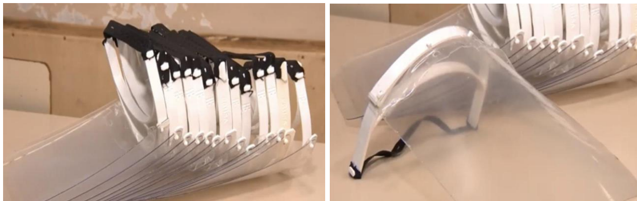
Figura 2: Máscaras de proteção facial