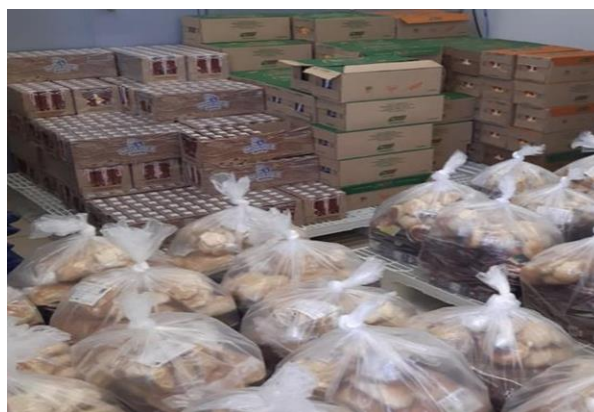
Figura 4: Kit alimentação doados