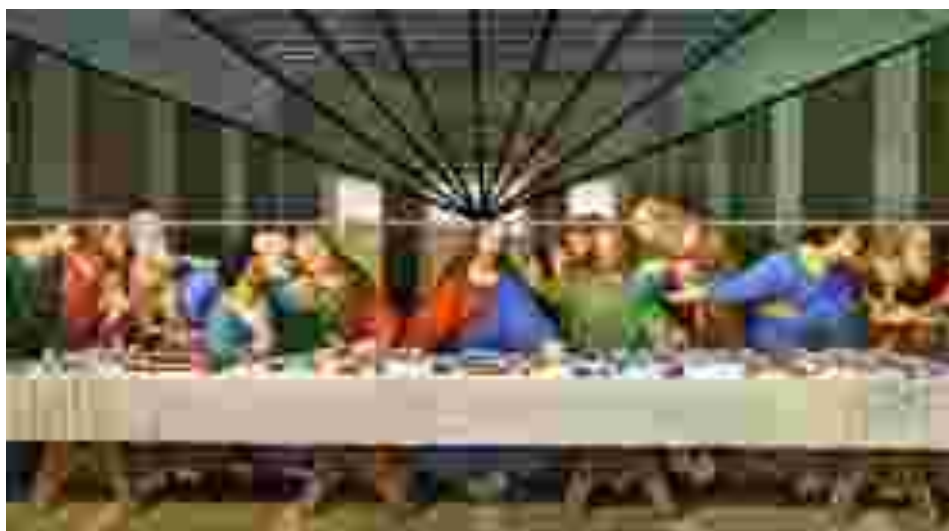
Figura 5: Quadro de Da Vinci A última ceia modificado com o uso de software .

Após apresentar as noções básicas da Geometria Projetiva, a partir das Figuras 1, 2 e 3, sugerimos que apresente A última ceia , de Leonardo da Vinci (Figura 4), e solicite aos alunos que procurem identificar na imagem o ponto de fuga e a linha do horizonte. Caso isso não aconteça de imediato, uma sugestão é indicar o uso de softwares de edição de imagens para traçar as linhas paralelas na parte superior dela, e com isso obtemos a imagem representada na Figura 5.