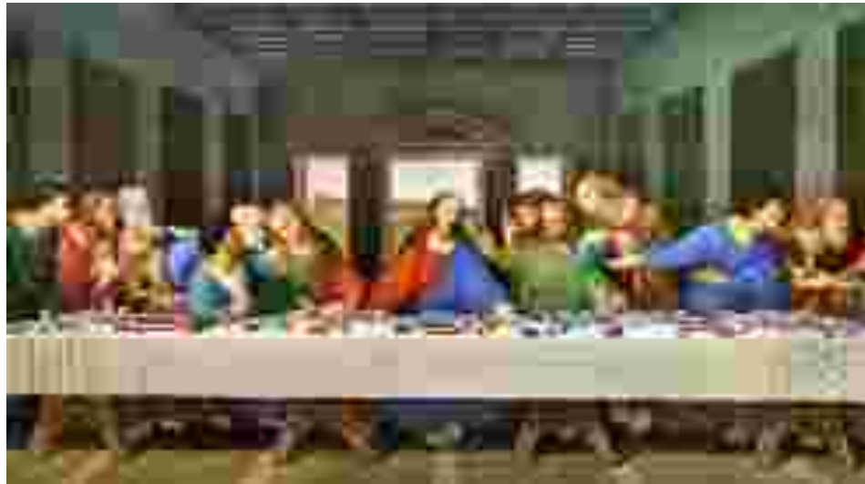
Figura 4: Imagem do quadro A Última Ceia , de Leonardo da Vinci.

que ilustram o tratado Della Pittura , e obras do período renascentista que utilizam a técnica de pintura a partir das noções hoje conhecidas como Geometria Projetiva. Nossa sugestão é explorar esses conceitos a partir de A última ceia , de Leonardo da Vinci representada na Figura 4.