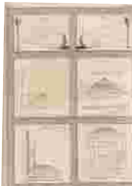
Figura 1: Primeira página de ilustrações em Della Pittura

As Figuras 1 e 2 foram retiradas do tratado Della Pittura de Leon Battista Alberti, o primeiro a sistematizar matematicamente os conceitos de Geometria Projetiva (HEFEZ, 1985; BOYER, 2012). A partir delas, destacamos um recorte no qual discutimos aspectos relacionados ao conceito que o autor procurou elucidar.