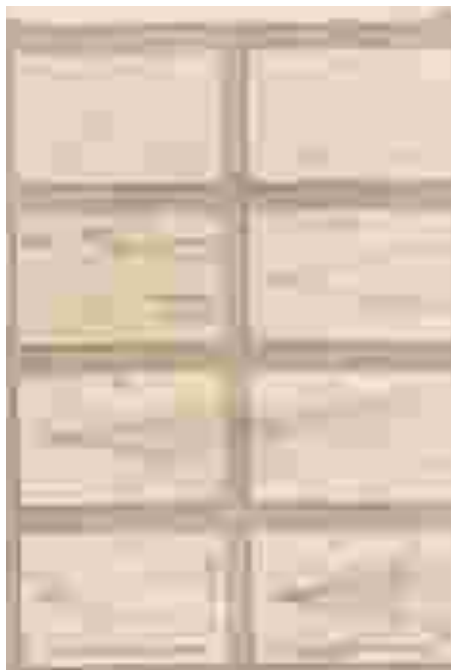
Figura 2: Segunda página de ilustrações em Della Pittura