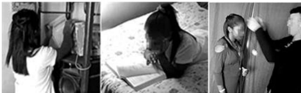
Figura 9: À esquerda, está sendo representado o momento que Sophie Germain toma conhecimento da história de Arquimedes a partir de um livro da biblioteca de seu pai; ao centro, ela está debruçada sobre o livro em questão; e à direita, está recebendo o prêmio por suas contribuições na teoria da elasticidade.

fundamentais na teoria dos números e teoria da elasticidade, pela qual ganhou um prêmio da academia francesa, ramo no qual foi pioneira. A primeira cena apresentou o momento em que Sophie tomou conhecimento, a partir da biblioteca de seu pai (Figura 9, esq.), de uma obra que continha algumas contribuições de Arquimedes, o que a motivou nos seus estudos (Figura 9, cent.) sobre Matemática (EVES, 2004).