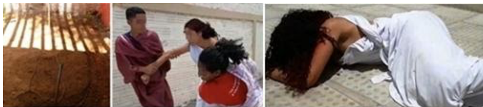
Figura 7: À esquerda, tem-se uma elipse desenhada na areia, ao centro, Hipátia está sendo levada pelos cristãos para ser assassinada e, à direita, seu corpo após o assassinato.

basicamente os seguintes momentos: a descoberta de que a trajetória descrita pela terra em torno do sol é elíptica. Nessa cena, tal trajetória é desenhada na areia (Figura 7, esq.), assim como no filme Alexandria; o momento em que Hipátia é levada (Figura 7, cent.) pelos cristãos e, posteriormente, assassinada (figura 7, dir.), por eles a verem como uma herege.