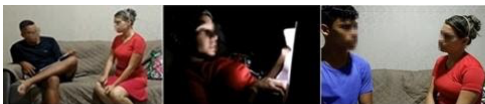
Figura 8: À esquerda sendo representado o diálogo entre Sophie Germain e seu pai, em que ele diz que ela deveria cuidar do lar ao invés de estudar; ao centro, Germain estuda à luz de velas e, à direita, Sophie intercede pela vida de Gauss por meio de seu primo.

Assim como na maioria das equipes, a personagem selecionada pela equipe C2 para o curta-metragem foi Sophie Germain. As cenas por eles elaboradas abordavam basicamente os seguintes momentos: diálogo entre a personagem e seu pai (Figura 8, esq.), no qual ele diz que ela, em vez de estudar, deveria cuidar do lar; Sophie estudando matemática na madrugada à luz de velas (Figura 8, cent.); o interesse dela em se corresponder com outros matemáticos por intermédio de cartas (GARBI, 2010); momento em que Sophie intercede pela vida de Gauss, pedindo ajuda a seu primo, que era general (Figura 8, dir.) e a interferência de Gauss junto ao conselho para conceder a Sophie o título de doutora (GARBI, 2010).