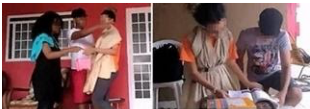
Figura 1: À esquerda, o pai de Mary Somerville a enviando para um internato e à direita, ela compartilhando seu interesse pela ciência em conjunto com seu segundo marido.

Na Figura 1 (esq.), está sendo representado o momento do curta-metragem em que o pai de Mary Somerville, personagem escolhida por tal grupo, a envia para um internato quando ela tinha dez anos 9 . Já na Figura 1 (dir.), os estudantes estão encenando a relação entre Mary Somerville e seu segundo marido, representando o fato de que ambos compartilhavam do interesse por ciência, como apontado por Eves (2004).