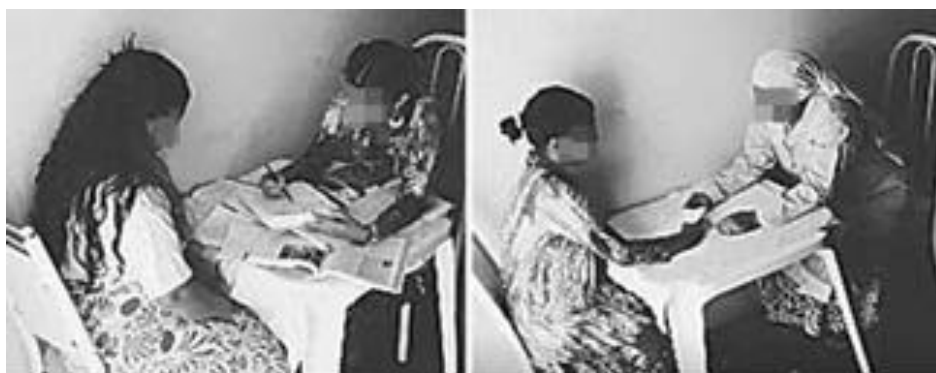
Figura 6: Maria Gaetana ajudando um de seus irmãos com Matemática (esq.) e fazendo caridade no final de sua vida (dir).

Com relação à equipe B4, as cenas descritas por eles sobre a personagem Maria Gaetana Agnesi abrangeram momentos em que ela ajuda um de seus irmãos com conteúdos relacionados à Matemática (EVES, 2004) (Figura 6, esq.); manifesta o desejo de se tornar freira pedindo ao seu pai que a enviasse para um convento, solicitação que foi negada por ele (MARTINS, 2015); dedica-se à caridade, fazendo doações (GARBI, 2010) (Figura 6, dir.) e também encenaram o momento de sua morte natural, já idosa.