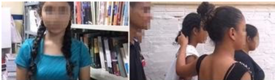
Figura 5: À esquerda temos o narrador, e à direita, Hipátia sendo levada pelos cristãos.

Com relação às cenas que tal equipe apresentou, destacam-se as seguintes: Hipátia lecionando sobre Astronomia; momento em que seu pai reconhece que ela está superando nos estudos (IGNOTOFSKY, 2017); diálogo em que seu pai condena a ideia de ela se casar, pois isso a impediria de divulgar suas ideias filosóficas; a entrega da biblioteca de Alexandria aos cristãos após a tomada de poder por eles; a personagem em questão recusando-se a se batizar como cristã por entender que não devia barganhar a fé (GARBI, 2010) e, logo após, sendo levada (Figura 5, à direita) por um grupo de cristãos para ser assassinada em seguida.