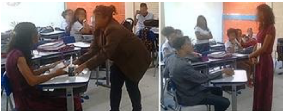
Figura 4: À esquerda, o pai de Sophie Germain apreende suas velas e à direita ela tem sua verdadeira identidade revela à Pierre-Simon Lagrange.

Diferentemente de todas as outras equipes, a equipe B2 optou em realizar o trabalho por meio de um teatro em sala de aula. As cenas apresentadas por tal grupo destacaram os seguintes fatos ocorridos na vida de Sophie Germain: a falta de apoio por parte de seu pai no início de sua carreira, em que ele confiscou as suas velas (Figura 4, à esquerda) para que ela não estudasse durante a noite (SINGH, 2014) e o episódio em que ela se fez passar por um ex-aluno para que pudesse acompanhar as aulas da École Polytechnique (GARBI, 2010), tendo, posteriormente, sua identidade revelada a Pierre-Simon Lagrange (Figura 4, à direita).