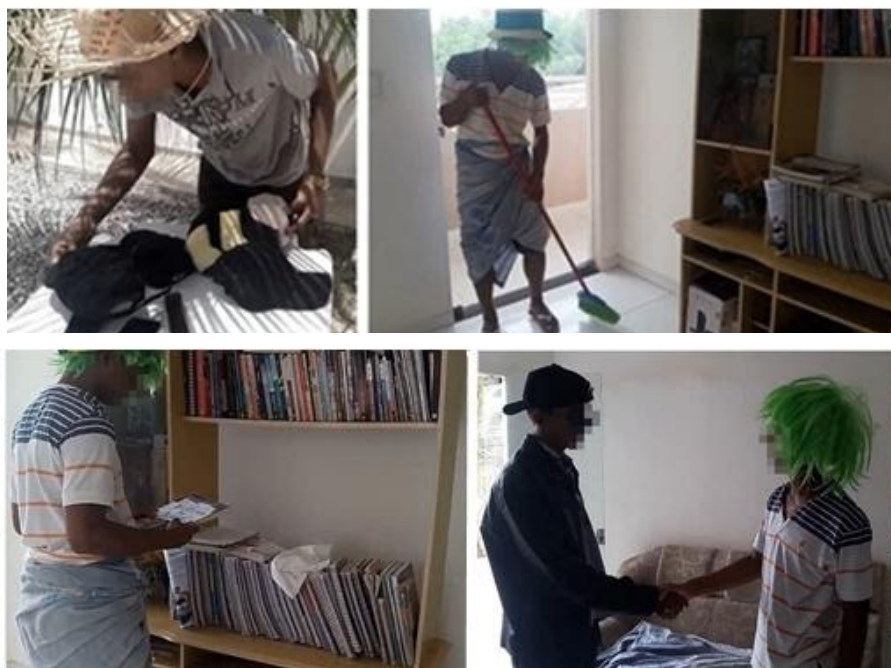
Figura 3: O pai de Sophie Germain desempenhando o papel de comerciante (esq. acima) e Sophie cuidando do lar (dir. acima). Abaixo, à esquerda, Sophie Germain descobrindo o livro de História de Matemática na biblioteca de seu pai, e abaixo, à direita, conhecendo pessoalmente Carl Friedrich Gauss.

Por sua vez, os componentes da equipe B1, assim como A2, fizeram um curta-metragem sobre Sophie Germain. No início do vídeo, ilustraram o fato de o pai de Sophie ter sido negociante (Figura 3, acima, à esquerda) e a preocupação dele em relação a ela ser criada para “cuidar do lar” (Figura 3, acima, à direita), fato evidenciado por (SINGH, 2014).