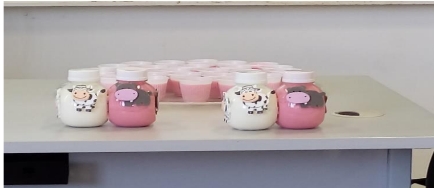
Foto 2: apresentação do produto “ Animal’s Milk ” (leite com morango)

Produto 3: Macarrão instantâneo integral: produzido com grãos e farinha integral, de modo a atingir o consumidor que precisa de um alimento de rápido preparo, mas também preocupado com uma alimentação saudável. Nome do produto “ Noodles Mug ”.