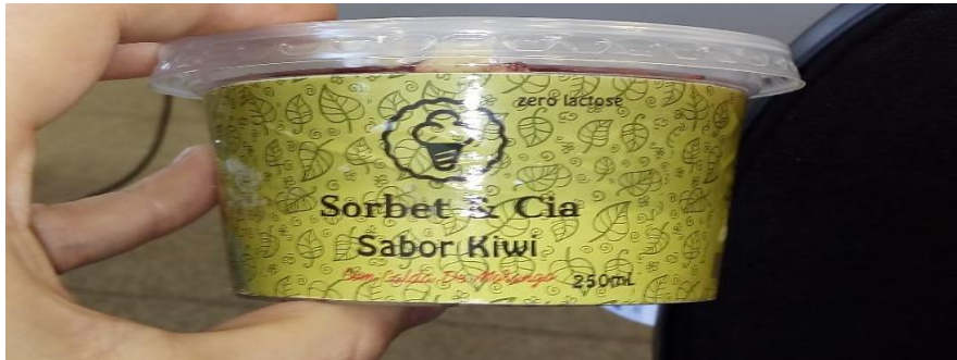
Foto 4: apresentação do produto “Sorbet & Cia” (sorbet de frutas)

Produto 5: Espumante de Goiaba: bebida feita a base de goiabas brancas e vermelhas.