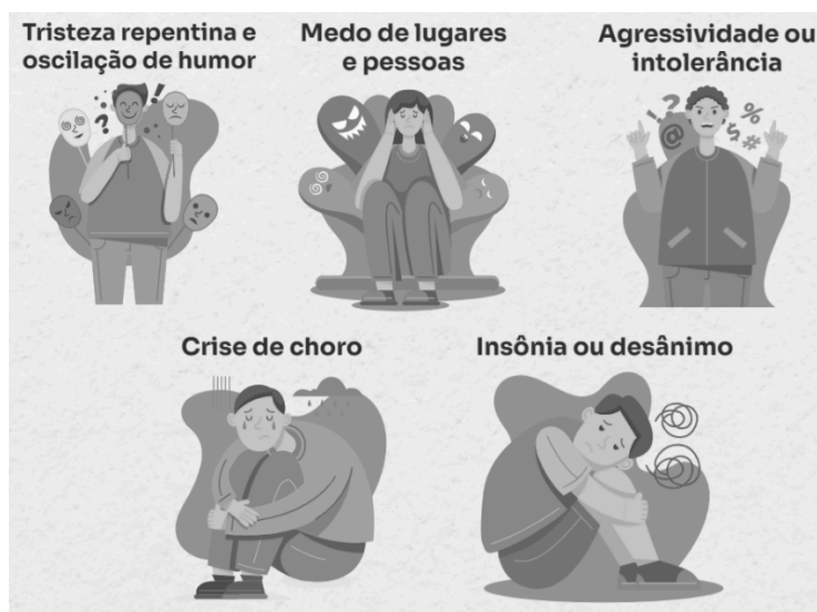
Figura 1 - Mudanças bruscas no comportamento da criança como indicadores de ASI