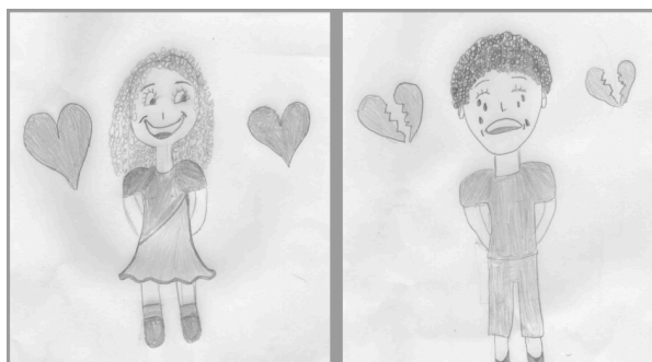
Figura 2 - Representação de crianças expressando humor eufórico e disfórico.

Resultados esperados: Capacidade de nomear condutas alheias; maior consciência emocional; percepção de situações de abuso